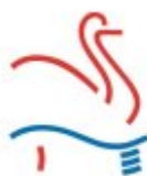
Hoogheemraadschap De Stichtse Rijnlanden